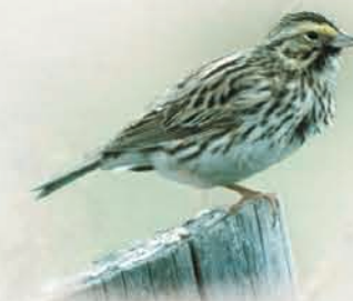
Ci contre : Bruant des prés